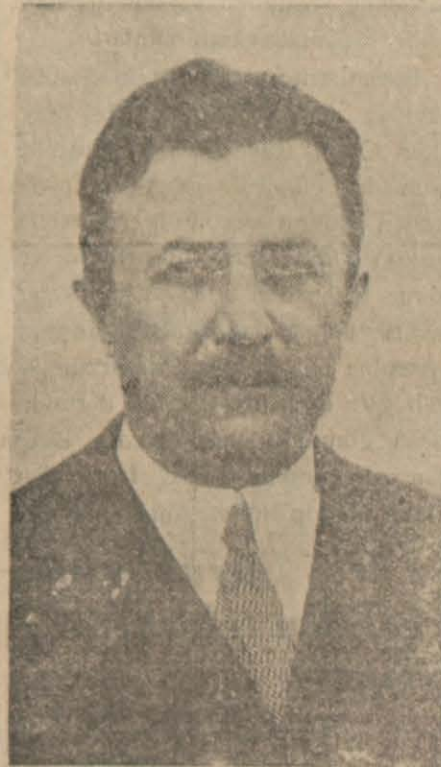
İç İşler Bakanı Şükrü Kaya İç İşler Bakanlığı yeni sayılab seçimi için vilâyetlere Cum

huriyet Halk Fırkası da kurumlarına yayımlar yollamışlardır. Yeni seçim on beş şubatta bitecektir.