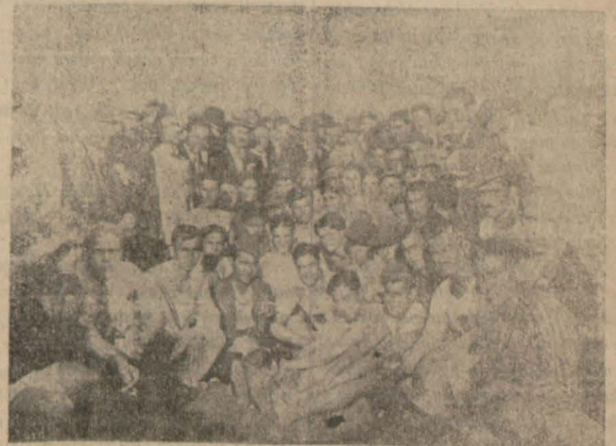
İdman Yurdu Oyuncuları Yarılılarla Bir Arada

Bir hafta evvelki Cuma günü berabere kalan Mersin ve Adana takımları bu cuma günü yine Adana top alanında karşılaştılar. Türk Sözü gazetesinin koyduğu kupa bir sehpa üzerinde ve alanın bir kenarında pırıldyordu.